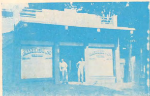
El nuevo edificio donde quedará definitivamente instalado el expendio y taller de la Talabartería.