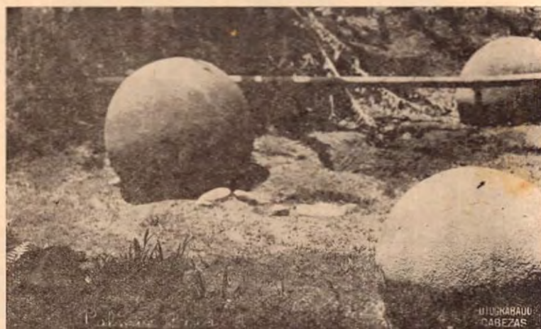
Las famosas bolas esculpidas por los indios Térrabas o Boricuas, en la región Sur del país

Puntarenas, noviembre 14 de 1954. Rafael Armando Rodríguez G.