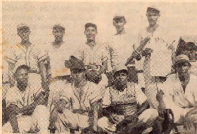
EL CONDOR, equipo de Beisbol de Bataan

en diversos aspectos del abacá—son casa de estilo uniforme: sobre una plataforma cementada de unos cinco por siete metros, se alzan las bases de unos dos metros y medio, que sostienen una construcción de seguridad, apariencia y comodidad apropiadas. En tales circunstancias, la vivienda queda en admirables condiciones de aereamiento y soleación.