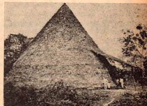
Forma cónica de las viviendas de los indios de la región Sur de Costa Rica

hay muy pocas referencias. No se sabe a ciencia cierta desde cuándo es esta nación indígena en vivir en esas montañas septentrionales del país.