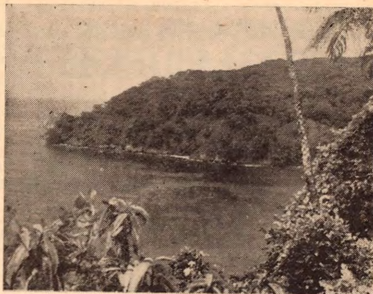
BAHIA DE CHATHAN

Dan comienzo las operaciones de exploración y así va discurrendo todo con su aparente normalidad hasta que los dos detectives